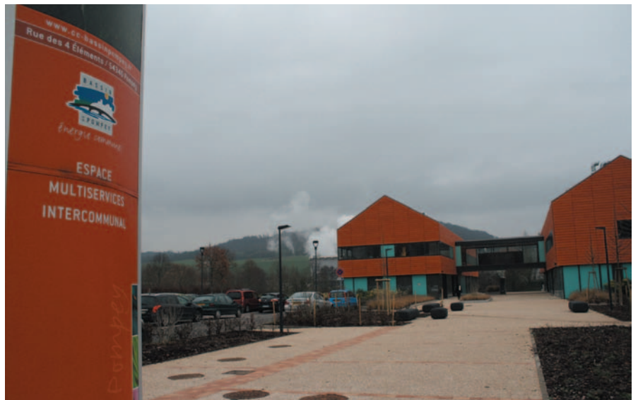
Le Bassin de Pompey regroupe 13 communes et 42 000 habitants.

«Au cœur de la collectivité, on mixe les enjeux environnementaux, économiques et sociaux», confie le président de l'intercommunalité. Si, au départ, une